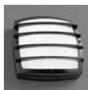
Griglia a 4 barre Nera